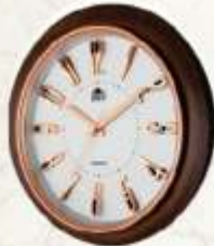
M.No. 354 Size :- 400 x 400 m.m.