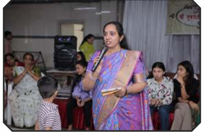
રાત્રિનું મન પસંદ ભોજન લઈ સર્વો જયશ્રી ગોપાલ કરી છુટા પડ્યા.