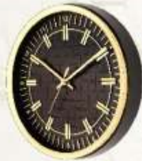
M.No. 377 - Round Clock Size :- 250 m.m. (8 Inch)

RAKESHBHAI - 94262 21810 | DIPAKBHAI - 98790 02106