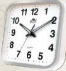
M.No. 320 Clock Size :- 250x250 m.m.

MANUFACTURING OF WEIGHING SCALES & SPARE PARTS