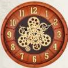
M.No. 371 - Gear Clock Size :- 16 x 16 Inch.