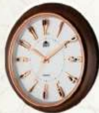
M.No. 354 Size :- 400 x 400 m.m.