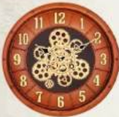
M.No. 371 - Gear Clock Size :- 16 x 16 Inch.