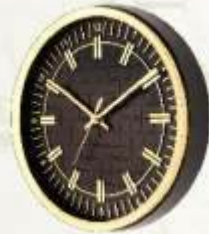
M.No. 377 - Round Clock Size :- 250 m.m. (8 Inch)

RAKESHBHAI - 94262 21810 | DIPAKBHAI - 98790 02106