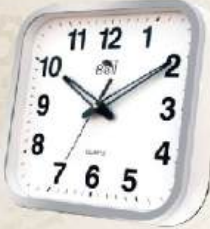
M.No. 320 Clock Size :- 250x250 m.m.

MANUFACTURING OF WEIGHING SCALES & SPARE PARTS