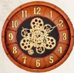
M.No. 371 - Gear Clock Size :- 16 x 16 Inch.