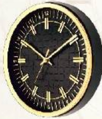
M.No. 377 - Round Clock Size :- 250 m.m. (8 Inch)

RAKESHBHAI - 94262 21810 | DIPAKBHAI - 98790 02106