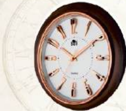
M.No. 354 Size :- 400 x 400 m.m.